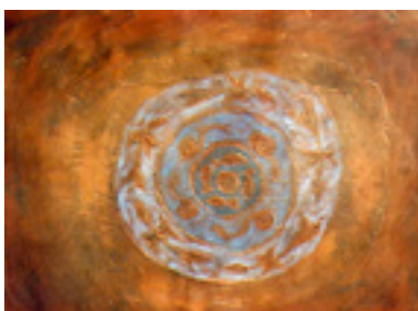
Totem des présages . 1998 Techniques mixtes 65,5 X 50,5 cm