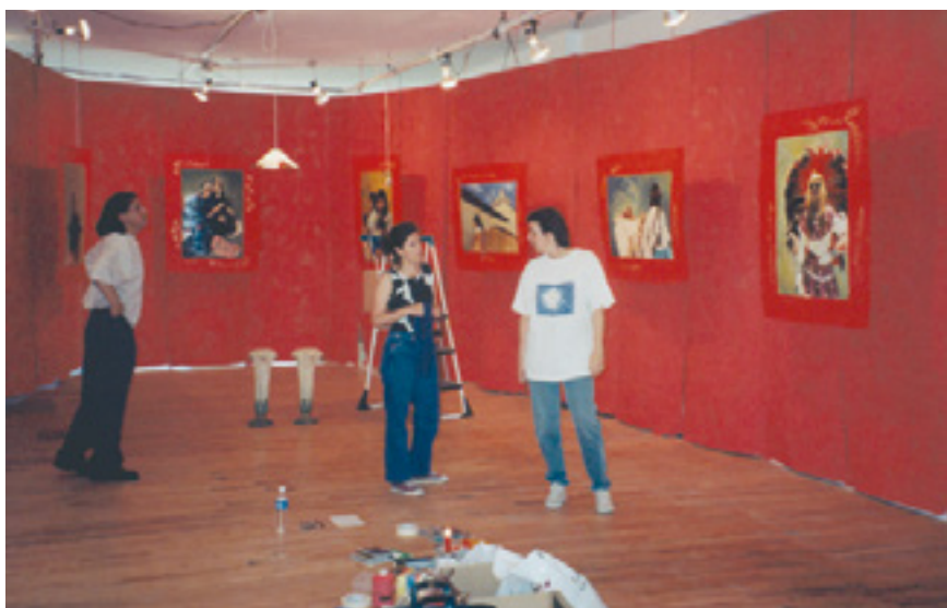
Pieds Rouges . 1998 . Installation photographique 7 X 12 mètres . vue partielle . Édifice Belgo