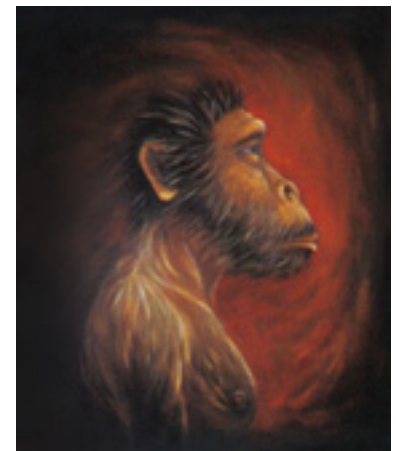
Australopithecus Afarensis . 1990 Acrylique