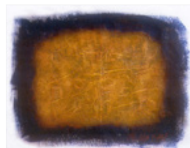
Graffiti I . 1997 Techniques mixtes 66,5 X 52 cm