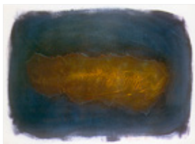
Fossiles XV . 1996 Techniques mixtes 57 X 38 cm