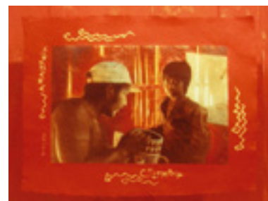
Amazonia, Colombia . 1998 Techniques mixtes 122 X 91,5 cm

Une installation où des photographies sont peintes pour ramener le personnage au premier plan. Des photos montées sur un Chiffon 100% coton et accrochées en demi-cercle, sur fond rouge, un rappel des rituels autochtones. Il va sans dire que le rouge évoque aussi le génocide indigène.