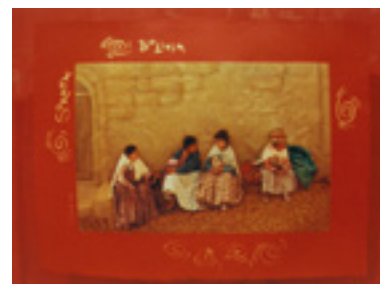
Sorata, Colombia . 1998 Techniques mixtes 122 X 91,5 cm