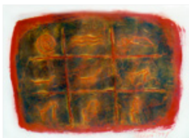
La création . 1997 Techniques mixtes 65,5 X 50,5 cm

Par la suite, des lieux fertiles en vestiges anciens me font découvrir les hiéroglyphes, pictographie indigène, première forme d'écriture humaine et seconde empreinte laissée dans le roc. Les cultures originaires d'Amérique présentent un vaste échantillonnage des débuts de la graphie et c'est par leur