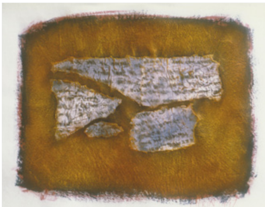
Graffiti III . 1997 Techniques mixtes 66,5 X 52 cm

De cette dynamique involutive est née la série Fossiles . C'est par l'utilisation de techniques mixtes (collage, incrustation, embossage, moulage...), le plus souvent sur des matières brutes (papier, carton ou tout autre support recyclable), que je façonne ce qui ressemble aux restes de notre premier ancêtre marin.