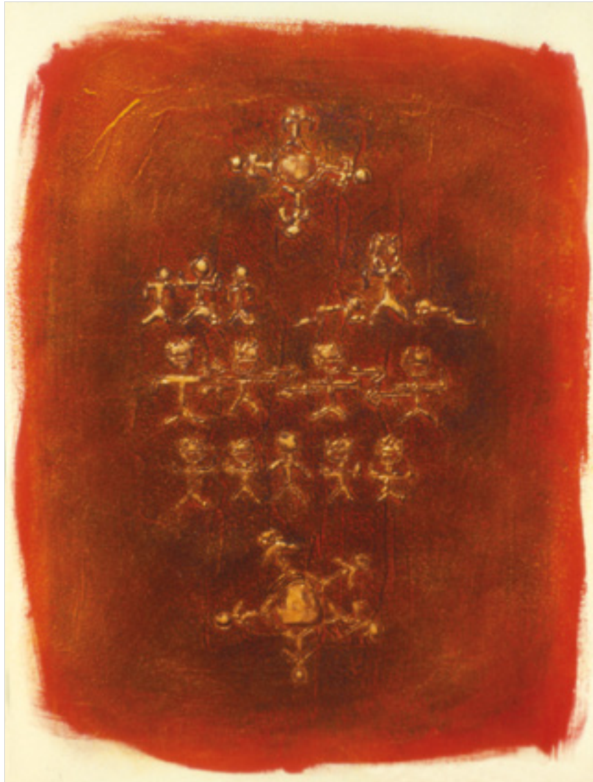
La 5e race. 1998 Techniques mixtes . 122 X 91,5 cm

Que ce soit par l'exploration des fonds marins, des grottes de la préhistoire, la survie des civilisations ou le questionnement sur le point zéro de l'univers, mon intérêt pour l'origine de la vie demeure le même. Les codes visuels utilisés : la spirale, le poisson, la colonne vertébrale, les primates et les glyphes, démontrent l'intérêt que je porte à l'humanité, tant dans sa phase primaire qu'évolutive.