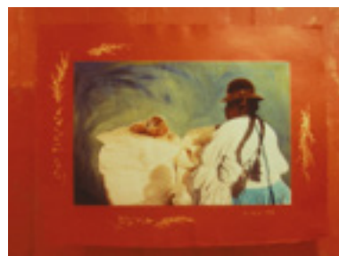
Lago Titicaca, Colombia . 1998 Techniques mixtes 122 X 91,5 cm