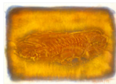
Fossiles 1955-III . 1995 Techniques mixtes 38 X 27 cm