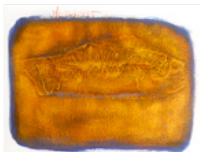
Fossiles 1955-II . 1995 Techniques mixtes 32,5 X 25,5 cm

Le travail évolue par le processus de transformation de la matière. L'intention alors, est de produire des fossiles sur un support ayant l'apparence de l'argile. Le poisson, témoin des divers stades de l'évolution de la vie animale, sans pour autant subir de mutations majeures, supporte l'évolution plastique de l'œuvre. La représentation du squelette permet l'identification à la colonne vertébrale qui nous plonge vers les débuts de l'humanité.